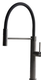
Miscelatore Skin Gun Metal 8424 856