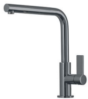
Miscelatore Omega Gun Metal 8497 856