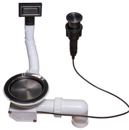
Piletta automatica Space Push Gun Metal - PO 8407 120