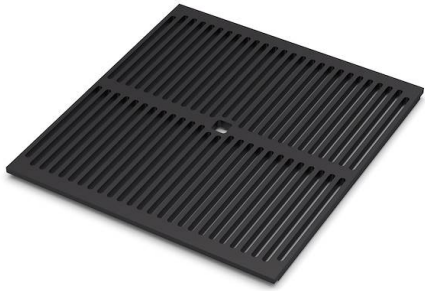
Griglia Black 8100 617