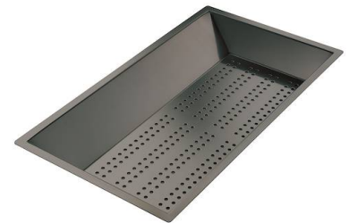
Vaschetta forata inox PVD Gun Metal 8151 006 * solo in abbinamento con l'accessorio 8644 101